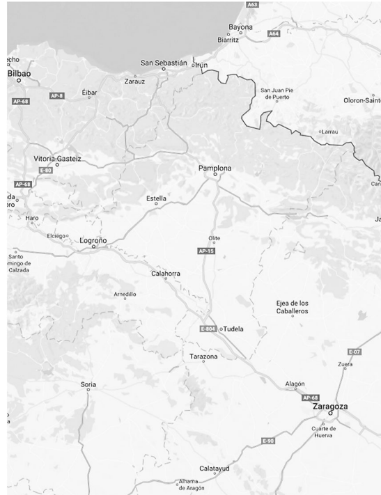
Mapas de zona. Señalización de gasolineras por páginas.