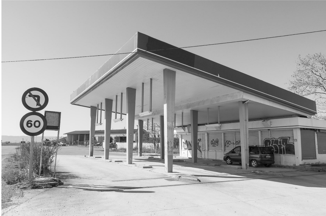
Venta de Arlás