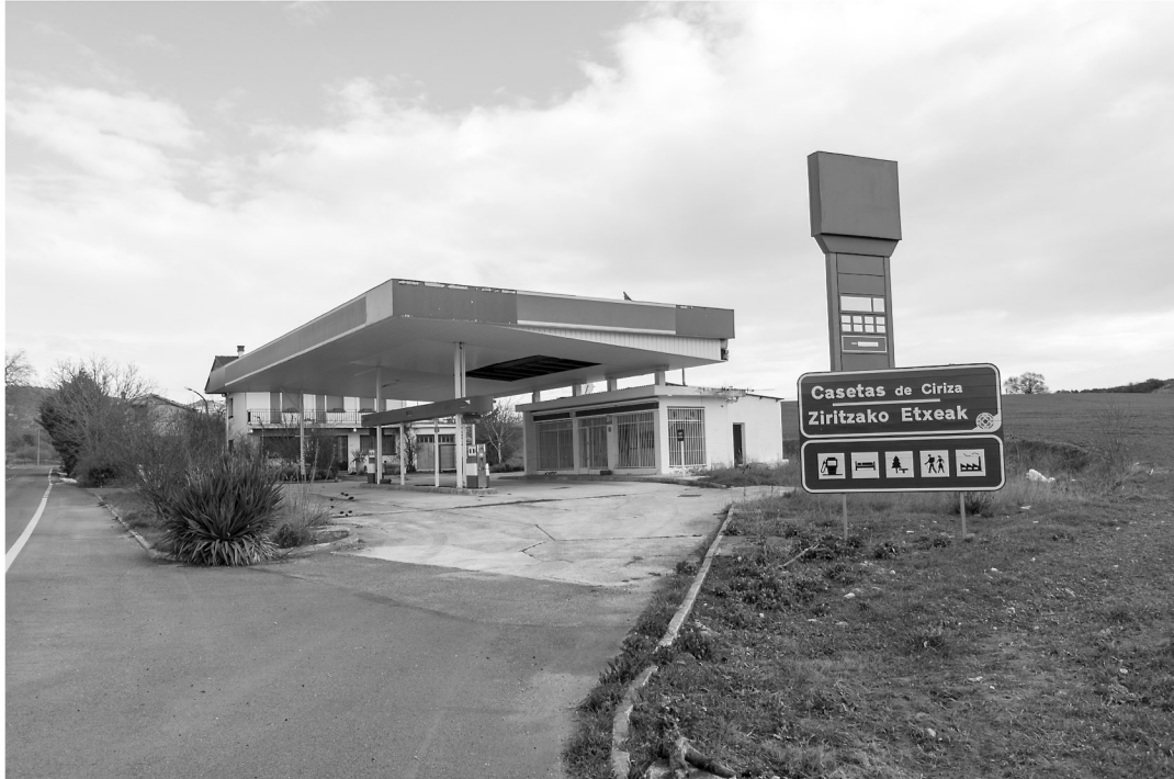
Casetas de Ciriza